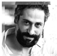
Rodrigue Sleiman Acteur